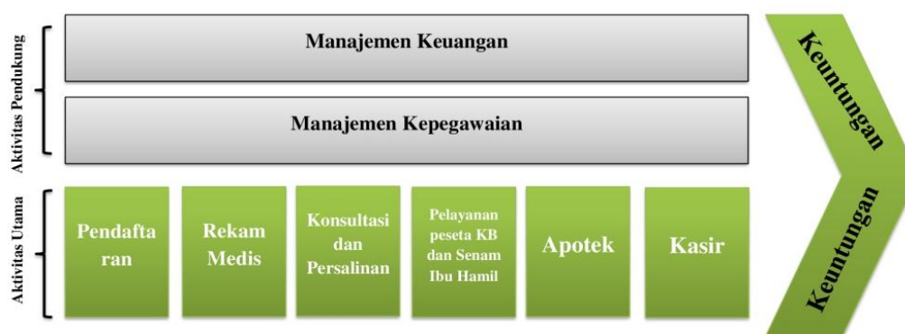
Gambar 2. Value Chain dan Diagram BPMN

Pada tahap ini, skenario bisnis perusahaan digunakan untuk menentukan model bisnis atau aktivitas bisnis yang diinginkan. Tujuan Arsitektur Bisnis adalah untuk dapat mendeskripsikan bagaimana proses bisnis yang sedang dilakukan di klinik Bidan Rosmiana dengan melalui penggunaan value chain dan diagram BPMN. Kemudian, usulan perbaikan akan dibuatkan dan digambarkan menggunakan diagram BPMN.